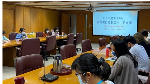
2023年召開書目控制 工作小組會議