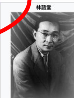
羅馬拼音 Lin Yitong

1923年回國，任北京大學教授和英文系主任，1924年後為《語絲》主要撰稿人之一，1926年出任北京女子師範大學教務長，同年到廈門大學任文學院長。1927年到武漢任中華民國外交部秘書，隨後的幾年當中，他創辦多本文學刊物，提倡「以自我為中心，以國魂為骨幹」的小品文，對之後的文學界影響深遠。1924年5月將英文的「humor」譯為「幽默」，有人說這是中文「幽默」一